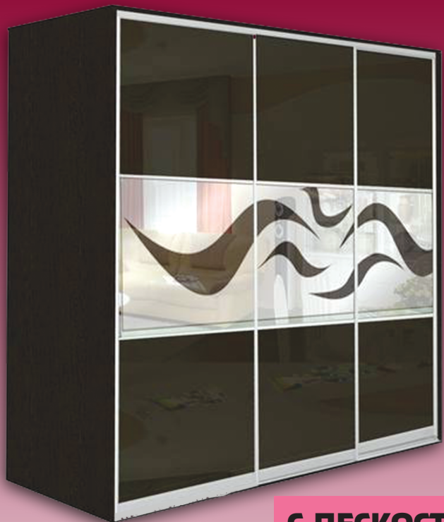
С ПЕСКОСТРУЙНЫМ РИСУНКОМ